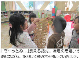
「そっとね..」震える指先、友達の息遣いを感しながら、協力して積み木を積み上げていきます。