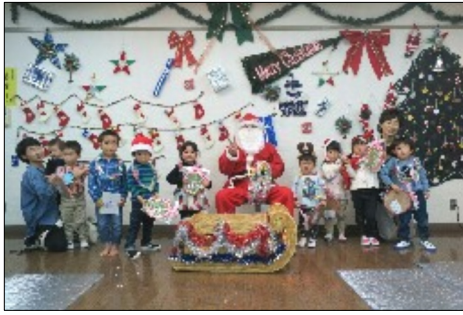
たんぼぼクラブ クリスマス会 12月13日

牧の台会館でたんぼぼクラブのクリスマス会がありました。サンタさんも登場で子どもたちは大喜びでした。