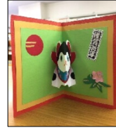
第124回 大和おもしろ塾「干支のカード作り」12月9日

牧の台会館でたんぼぼクラブのクリスマス会がありました。サンタさんも登場で子どもたちは大喜びでした。