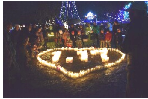
大和夢ナリエの消灯 1月17日

紙芝居などのお話を楽しんだ後、すこぶ福笑い、かるた、坊主めくりをしました。初めてのお友達とも仲良く遊び、集会室に初笑いの声が響きました。 【図書室】