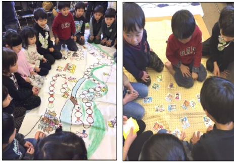
お正月あそび 1月10日

紙芝居などのお話を楽しんだ後、すこぶ福笑い、かるた、坊主めくりをしました。初めてのお友達とも仲良く遊び、集会室に初笑いの声が響きました。 【図書室】