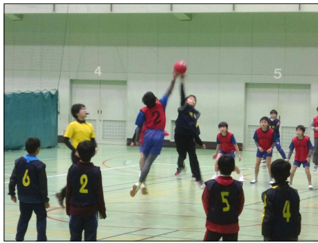
ドッジボール大会