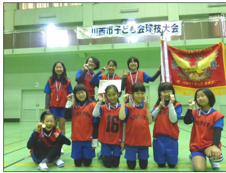
高学年女子部は優勝！

二月一八日に市子連主催のドッジボール大会が行われ、大和子ども会から三十六名が参加しました。低学年は一生懸命さがとてもかわいく、高学年は見ごたえのある白熱した試合が繰り広げられました。高学年女子部は優勝！低学年の部は二チームのうち一チームが三位に入りました。