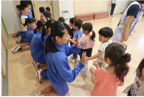
こども園でトライやるウィーク

5月末から5日間、東谷、明峰、多田の中学2年生がこども園にきました。こどもたちは中学生と楽しく触れ合うことができました。