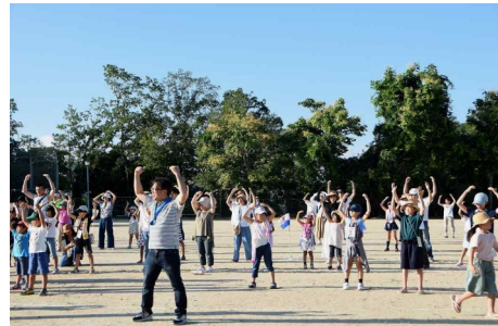
第15回 三世代早朝健康体操

7月21日、平木谷池公園グラウンドで3世代が青空の下、ラジオ体操やり取り、ゲームをしました。多くの子どもたちが集まりました。