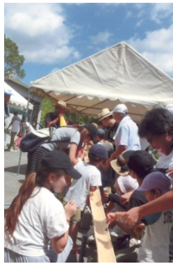
写真は和ホームページの街角だよりに掲載しています