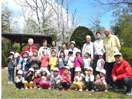
写真は和和ホームページの街角だよりに掲載しています