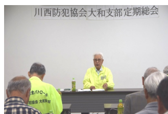
【川西防犯協会大和支部】

5月24日、第46回定期総会を開催しました。大和地区内の空き巣が増加していますので注意してください。交差点での出会い頭の交通事故が多発しています。交差点では安全確認をして予防運転をしましょう。総会では活発な意見交換が行われ、地域の安全・安心な街づくり行うこととし総会を終了しました。