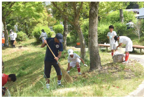
写真は和和ホームページの街角だよりに掲載しています