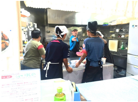
写真は和和ホームページの街角だよりに掲載しています