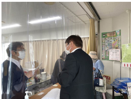
写真は和和ホームページの街角だよりに掲載しています