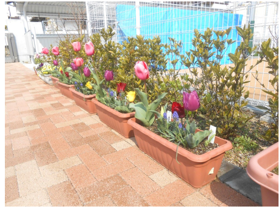
こどもたちが植えたチューリップが奇麗に咲いています♪