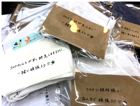
写真は和和ホームページの街角だよりに掲載しています