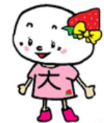
大和地区福祉委員会のイメージキャラクター「おひだまりちゃん」