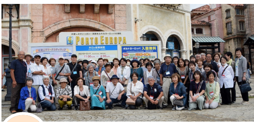
9/22 社会見学バス旅行は和歌山へ 74名の参加者で、湯浅醤油や和歌山自然博物館などを見学しました。 【社会教養部】