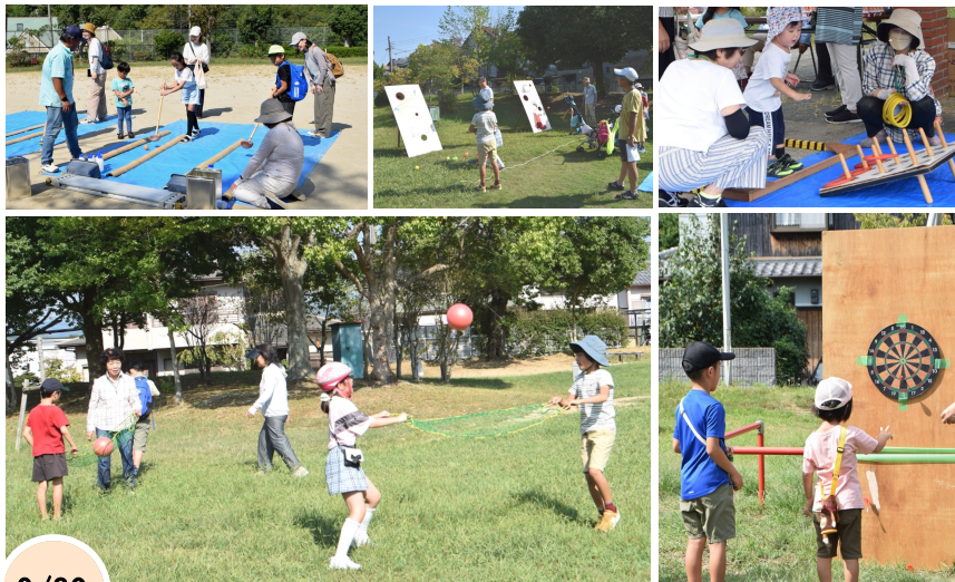
9/30 第3回大和フェスタ 秋晴れの中、丁理事さんたちが用意して下さった各公園のゲームで盛り上がりました 【体育部】