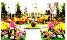
④奇跡の星の植物館