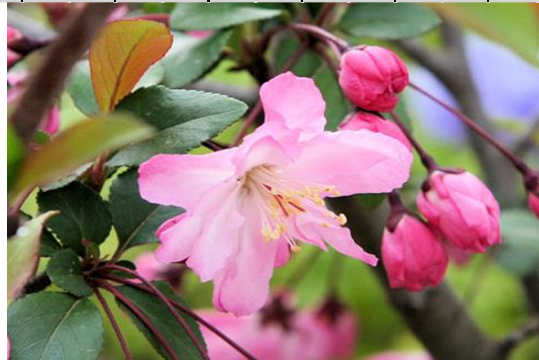
海棠（はなかいどう） 花言葉：艶麗

投稿は大和友愛クラブ宛自治会のポスト又は植木宅へ投函して下さい。 お待ちしております。次号掲載分は五月七日までに提出下さい。