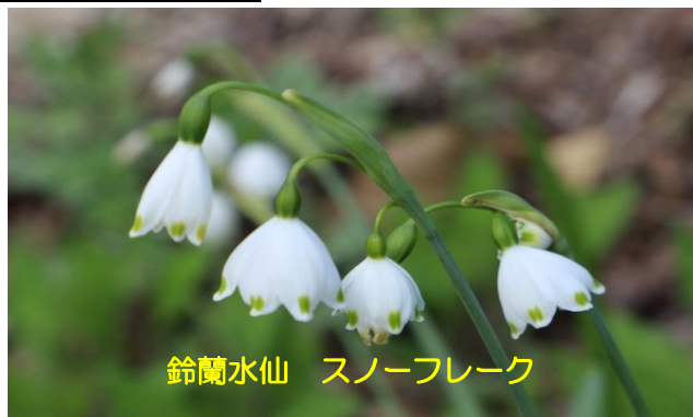
鈴蘭水仙 スノーフレック