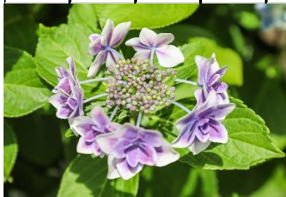
紫陽花（あじさい） 花言葉； 青、青紫；冷淡、無情、辛抱強い愛情 白；寛容 ピンク；強い愛情、元気な女性

投稿は大和友愛クラブ宛自治会のポスト又は植木宅へ投函して下さい。 お待ちしています。次号掲載分は七月七日までに提出下さい。