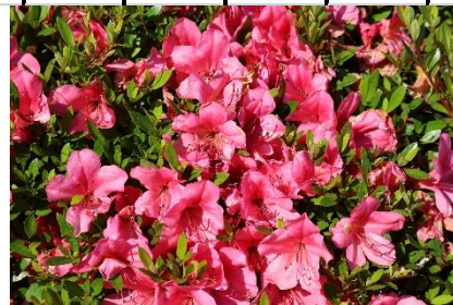
五月（さつき） 花言葉； 節約、貞淑、節制、幸福、 協力を得られる