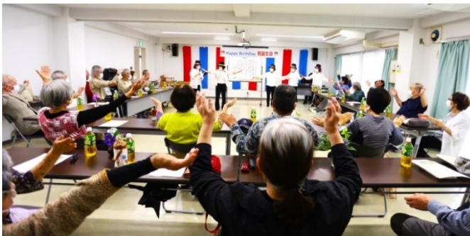
5 月生まれの誕生会・出演：くすくすキャンディーズ