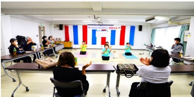
6 月生まれの方の誕生会・出演：自彊術部