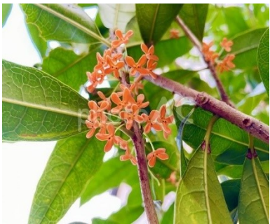
キンモクセイ（金木犀）

投稿は大和友愛クラブ宛自治会のポスト又は植木宅へ投函して下さい。 お待ちしています。次号掲載分は十二月七日までにご提出下さい。